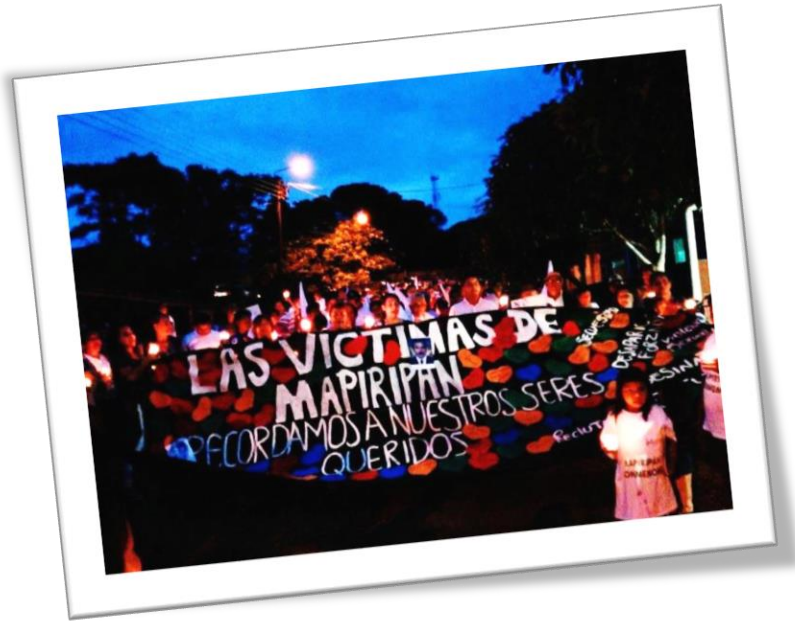
Marcha conmemorativa de los 20 años de la masacre de Mapiritan