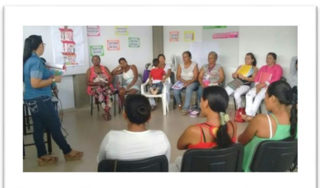
Behartutako lekualdatzeen biktimaren emakumeak gaituz