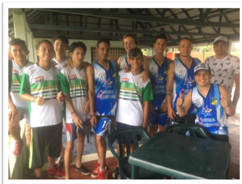
Jóvenes pertenecientes a FUIPC