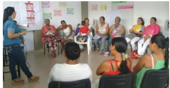
Capacitando a las mujeres víctimas de desplazamiento forzado